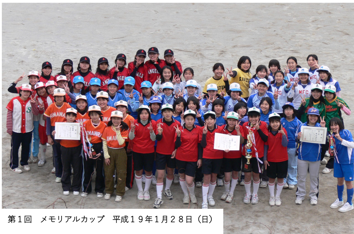
第1回 メモリアルカップ 平成19年1月28日(日)